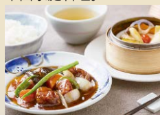
酢豚ランチセット 1,580円 (せいろ蒸し・ごはん・スープ付)