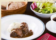
牛バラ肉の地ビール煮込み 1,900円(パン・サラダ付)