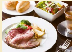
厚切りローストビーフセット 2,100円(サラダ・ドリンク付)