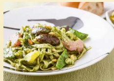
地豆たっぷり濃厚ジェノベーゼ 1,814円(パン・サラダ付)