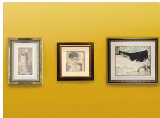
中央:「猫のいる自画像」(1926年コロタイプ・紙)ほか

藤田嗣治の作品に多く登場する猫をはじめ、藤田が描いた様々な動物にフォーカスし、その魅力に迫ります。動物へのまなざしや藤田の独特な世界観を楽しめます。