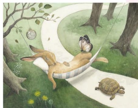
いまいあやの「イソップ物語 13のおはなし」 ©2012 Ayano Imai / BL出版

佐久市在住の絵本画家・いまいあやの氏による『イソップ物語 13のおはなし』(BL出版、2012年)の絵本原画を中心に、さまざまなイソップ童話をイラストとともに紹介。